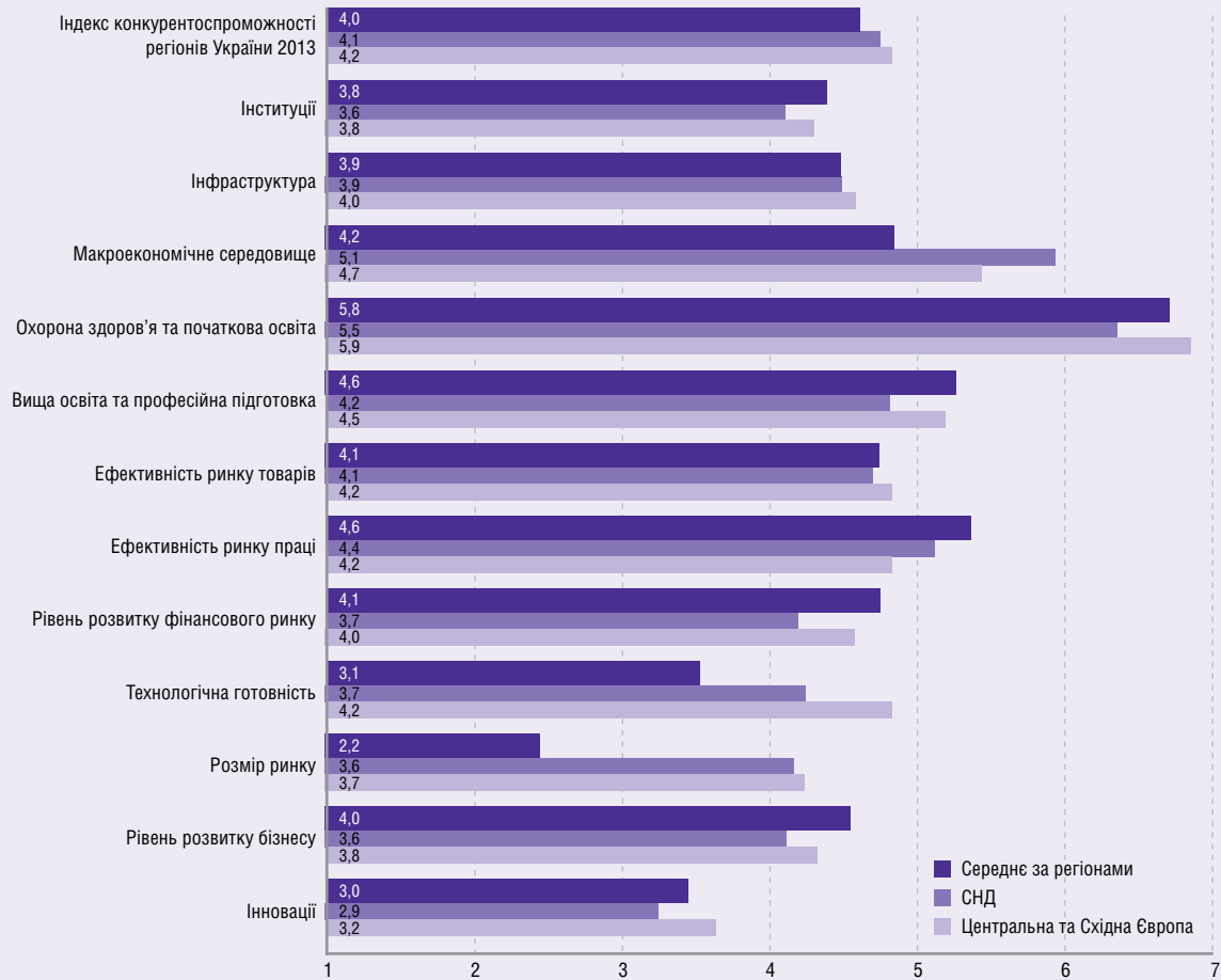
Рисунок 2.2 Середні оцінки регіонів України в 2013 році порівняно з країнами ЦСЄ та СНД